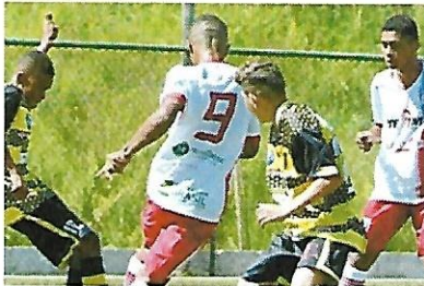
Atirado. AMDH e Novos Horizontes estrearam com dois empates PUBLICADO EM 23/03/19 - 20h38

DAVSEAGUIAR DAVSEAGUIAR@OTEMPOBETIM.COM.BR