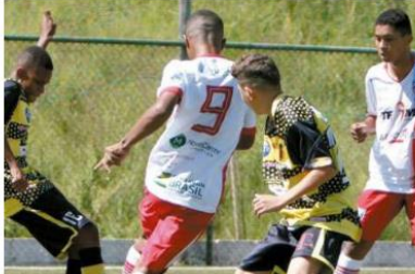
Acirrado, AMDH e Novos Horizontes estrearam com dois empates PUBLICADO EM 28/03/19 - 20h36

DAYSE AGUIAR DAYSE.AGUIAR@OTEMPOBETIM.COM.BR